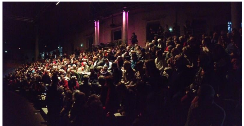
Grand amphithéâtre de la Cité du Livre d'Aix-en-Provence 23 janvier 2016