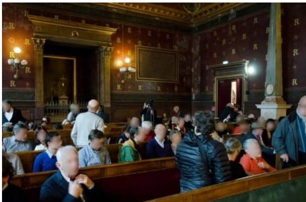
Grand'chambre du Palais de Justice de Toulouse 9 mars 2015